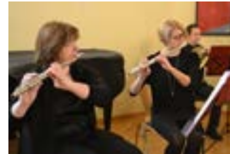
Im Bläserensemble 13