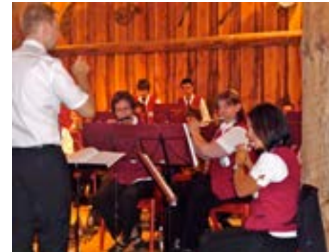
Im Musikverein Tunsel